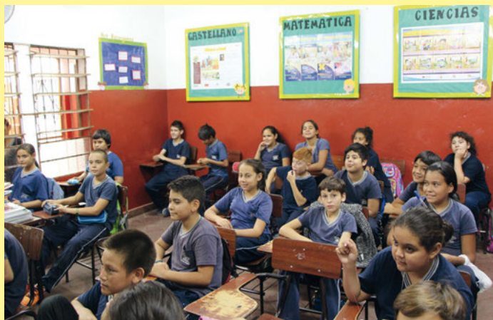
Bild links: Eine Schulklasse in Yalve Sanga (Paraguay). Die Dauer der Förderung der Kinder in ihrer Schule, Kindergarten oder Hort hängt von den staatlichen Vorgaben ab: In Brasilien dreht sich viel um die maximale Verweildauer im Programm. In Äthiopien steht der Schulabschluss im Zentrum der Regeln.

Patenschaften ermöglichen den Kindern eine Schul- und Berufsausbildung, die ansonsten von ihrem sozialen Umfeld diese Möglichkeiten nicht haben. Seit über 50 Jahren arbeiten wir mit Partnern in Südamerika und Äthiopien zusammen. Früher geschah dies über die IMO (Internationale Mennonitische Organisation). Seit einigen Jahren haben wir als Mennonitisches Hilfswerk (MH) die Verantwortung für die Förderung der 480 Kinder übernommen. Eine Patenschaft kostet 240 € / Jahr. Damit wird der Schulbesuch (Kosten für Bücher, Uniform, Gebühren und Verpflegung, u.a.) ermöglicht. An manchen Schulen gibt es auch eine Unterstützung durch Lebensmittel für die Familie. Viele Kinder erhalten so ihre einzige warme Mahlzeit am Tag.