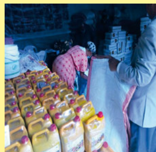
Bild oben: An vielen Orten konnten wir 2020 unseren Partnern durch zusätzliche Gelder bei den notwendigen Covid19 Maßnahmen helfen. An bedürftige Familien wurden Lebensmittel, Medikamente und Hygieneartikel verteilt.

Bedingt durch die Covid19 Pandemie stehen uns leider nur wenige aktuelle Bilder zur Verfügung. Wir hoffen auf Euer Verständnis.